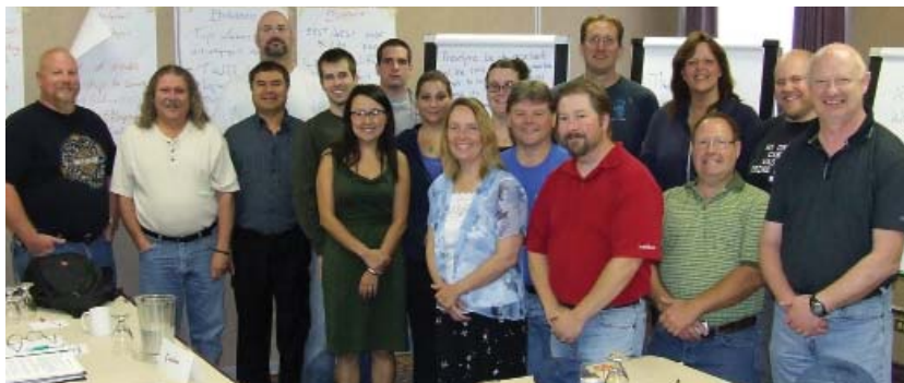
Cours de formation pour militant(e)s à Calgary.